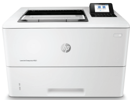
HP LaserJet Enterprise M507dn

Impresora apta para seguridad dinámica. Destinada solo al uso con cartuchos que usen un chip original HP. Los cartuchos que usan un chip de otro fabricante podrían no funcionar y los que funcionen, podrían no hacerlo en el futuro. http://www.hp.com/go/learnaboutsupplies